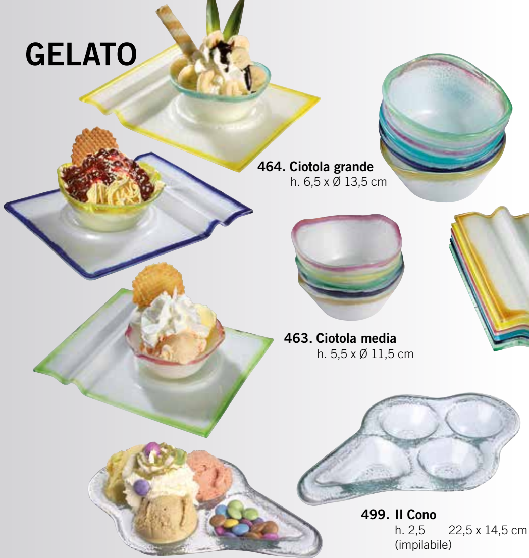
464. Ciotola grande h. 6,5 x Ø 13,5 cm