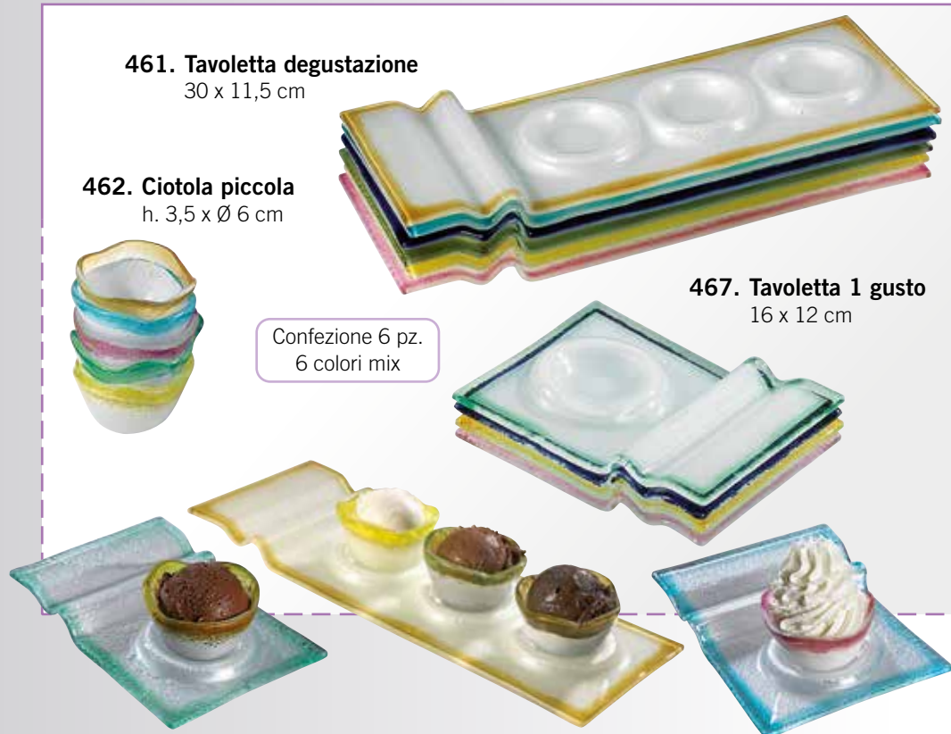
461. Tavoletta degustazione 30 x 11,5 cm