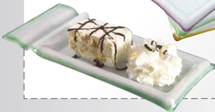
409. Tavoletta Dessert 30 x 14,5 cm