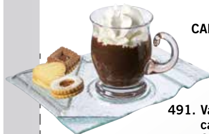
491. Vassoio cappuccino + brioche 2 scomparti 20 x 23,5 cm