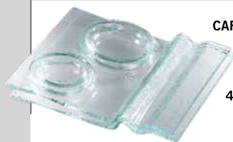
490. Vassoio caffè + acqua 2 scomparti 16 x 18 cm