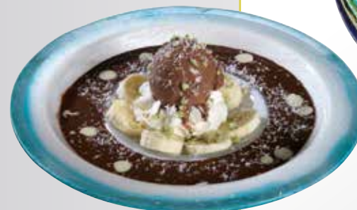
466. Piatto Cioccolata / Yogurt Ø 24,5 cm