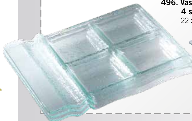
496. Vassoio aperitivo 4 scomparti 22 x 28 cm