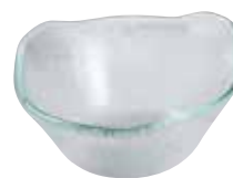
468. Ciotola Yogurt / Macedonia h. 5,5 x Ø 11,5 cm