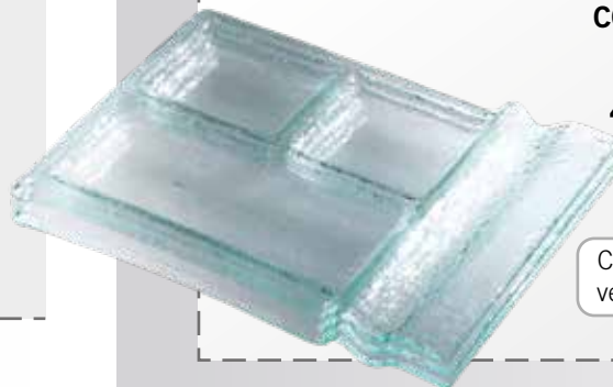
492. Vassoio colazione 3 scomparti 22 x 28 cm