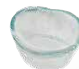
462.1 Ciotola piccola h. 3,5 x Ø 6 cm